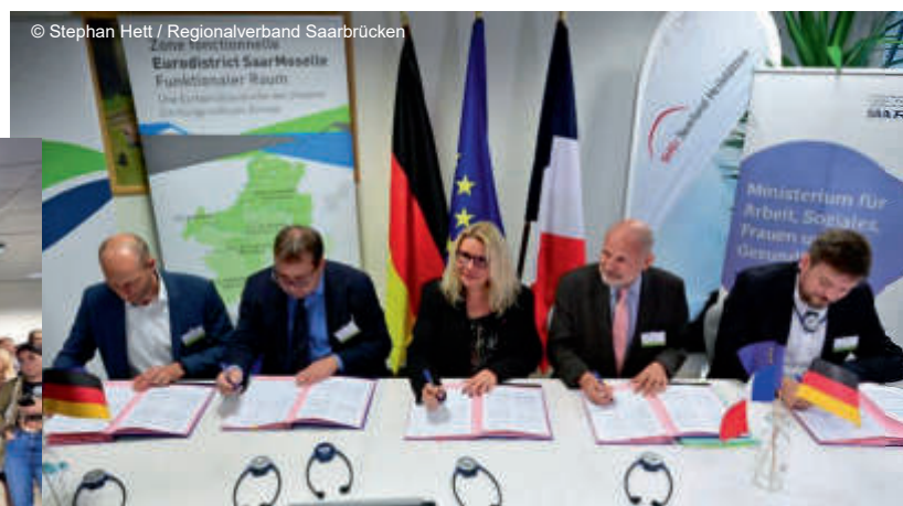
Feierliche Unterzeichnung des Zusatzprotokolls zur MOSAR-Vereinbarung im Bereich Nuklearmedizin Cérémonie de signature du protocole additionnel MOSAR en médecine nucléaire