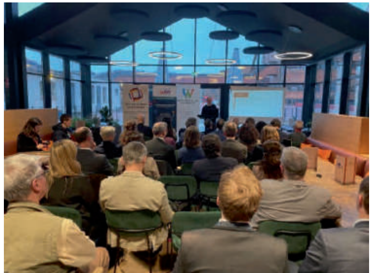
Grenzüberschreitendes Forum am 12.03.2024 im Parc Explor Wendel Forum transfrontalier du 12 mars 2024 au Parc Explor Wendel