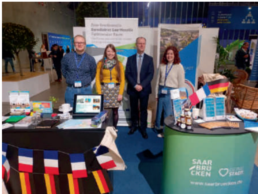
Europäisches Gipfeltreffen der Regionen und Städte in Mons Sommet européen des Régions et des Villes à Mons

Ce sommet a aussi été l'occasion pour l'Eurodistrict SaarMoselle d'échanger avec QuattroPole et la Grande Région.