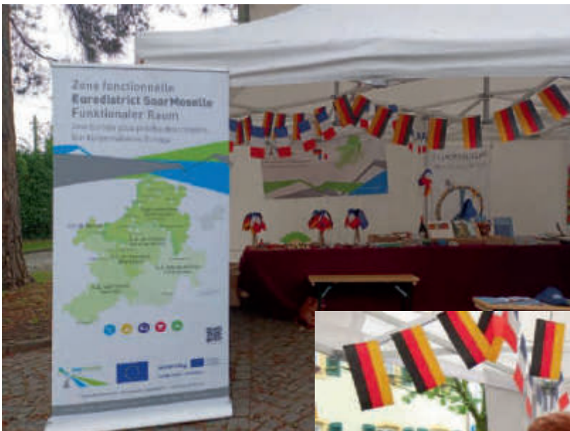
Eurodistrict-Stand auf dem Biosphärenfest Stand de l'Eurodistrict à la Fête de la biosphère

Le 30 juin 2024 l'Eurodistrict était présent, comme l'année dernière, sur le stand du Regionalverband Saarbrücken à la Fête de la Biosphère. La 18 ième édition de cette fête existante depuis 2004 a eu lieu à Kleinblittersdorf. Comme toujours, elle était surtout axée sur la régionalité et la durabilité. Malgré un temps malheureusement partiellement pluvieux, de nombreux visiteurs sont venus découvrir la diversité de la biosphère à travers les produits du terroir, les informations touristiques, les offres gastronomiques et culturelles. L'Eurodistrict a informé le public de ses projets en cours et notamment la Zone fonctionnelle Eurodistrict SaarMoselle, dans le cadre de laquelle des fonds FEDER du programme Interreg Grande Région sont attribués.