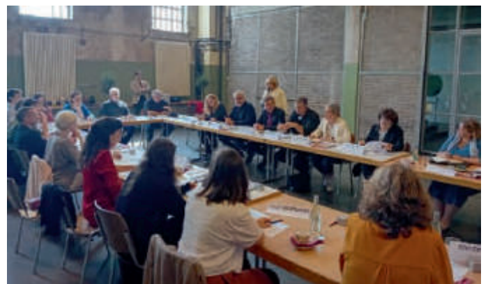
Netzwerktag 18. Juni 2024 im UNESCO-Weltkulturerbe Völklinger Hütte und im Parc Explor Wendel Journée réseau 18 juin 2024 au Patrimoine Mondial de l'UNESCO Weltkulturerbe Völklinger Hütte et au Parc Explor Wendel