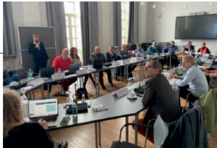
Veranstaltungsreihe „Rencontres franco-allemandes/Unternehmen stellen sich vor“- Linkes Bild: Präsentation von HoloSolis und Emil'Hy / rechtes Bild: Präsentation von Circa