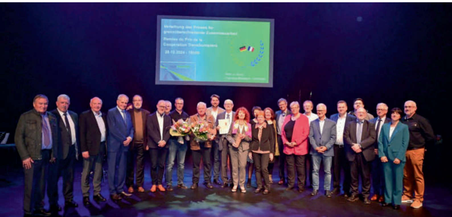
Preisverleihung für grenzüberschreitende Zusammenarbeit am 28.10.2024 im Espace Gouvy in Freyding-Merlebach Remise du prix de la coopération transfrontalière le 28 octobre 2024 à l'Espace Gouvy de Freyding-Merlebach

L'événement a bénéficié du soutien du Fonds citoyen franco-allemand.