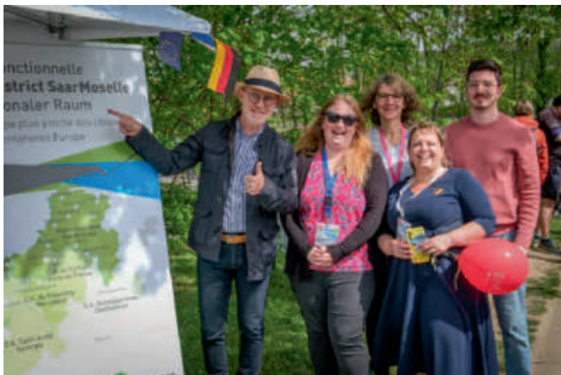
Weekend Eurosport SaarMoselle am 6. April 2024 in Grosbliederstroff Weekend Eurosport SaarMoselle le 6 avril 2024 à Grosbliederstroff

Ainsi, la majeure partie de l'année 2024 a consisté en l'accompagnement de porteurs de projets dans le montage de leur projet. Le projet Intervelo SaarMoselle a en plus bénéficié d'un accompagnement post-contractualisation. En outre, la manifestation de lancement de ce projet avec l'inauguration du premier tronçon d'une nouvelle piste cyclable a eu lieu le 28 septembre 2024 en présence de nombreux élus de l'Eurodistrict et de représentants du programme Interreg Grande Région.