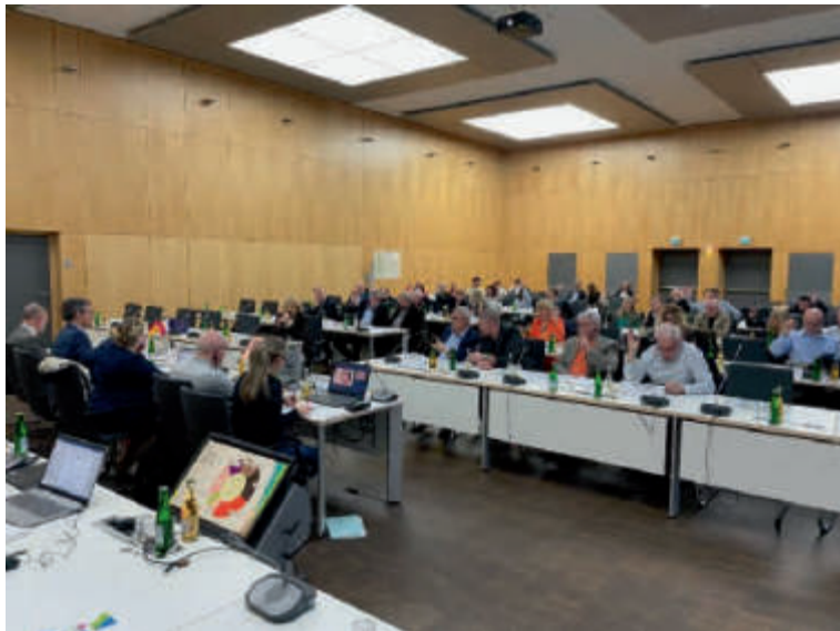
Linkes Bild: EVTZ-Versammlung im Rathaus Völklingen – rechtes Bild: Vorstandssitzung bei der CCW in Creutzwald Image de gauche : Assemblée du GECT à la mairie de Völklingen – image de droite : Comité Directeur à la CCW Creutzwald

Die Versammlung des EVTZ Eurodistrict Saar-Moselle trat 2024 vier Mal zusammen. Zwei Sitzungen wurden in Frankreich (Sarreguemines und Forbach) abgehalten, die beiden anderen im Saarland (Völklingen und Saarbrücken). Der Vorstand tagte 2024 viermal auf französischer Seite (zwei Mal in Forbach und je einmal in Freyming-Merlebach und Creutzwald).