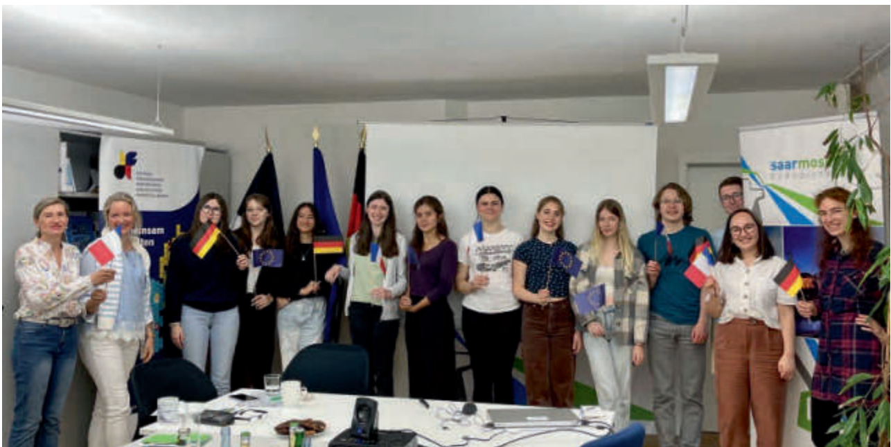
Besuch von Schüler*innen des Von der Leyen-Gymnasiums aus Blieskastel Visite d'élèves du lycée Von der Leyen de Blieskastel

Dans le cadre de ce programme, une quarantaine d'élèves du lycée Henri Poincaré de Nancy se sont rendus le 14 mai 2024 au bureau de coopération de Sarrebruck pour découvrir les activités et projets transfrontaliers menés par l'Eurodistrict et échanger avec l'équipe.