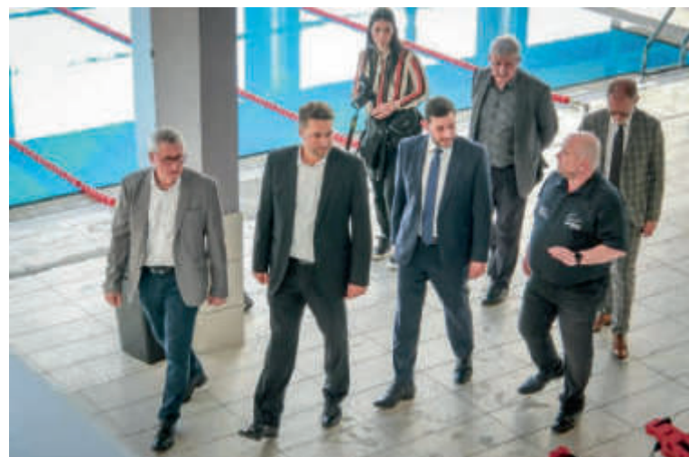
Eröffnungsabend des Weekend Eurosport SaarMoselle und Begehung des Olympiaschwimmbads in Forbach Soirée ouverture du Weekend Eurosport SaarMoselle et visite de la piscine olympique de Forbach