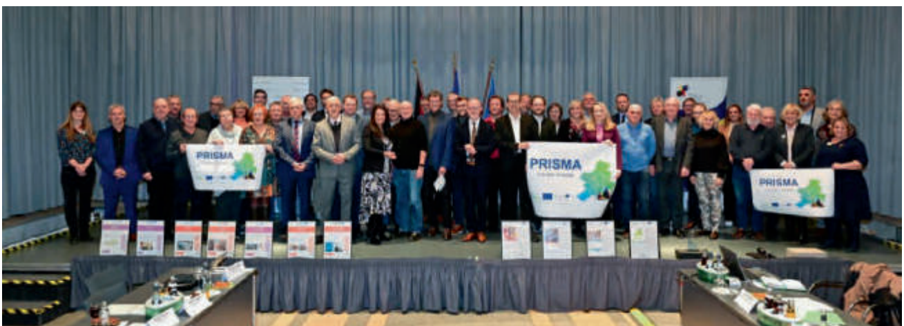
PRISMA-Projektlaunch bei der EVTZ-Versammlung am 27.11.2024 im Saarbrücker Schloss. Lancement du Projet PRISMA lors de l'Assemblée du GECT au château de Sarrebruck, le 27/11/2024.

Les partenaires souhaitent atteindre cet objectif à travers les mesures et les activités suivantes sur la période 01.01.2024 à 31.12.2026 :