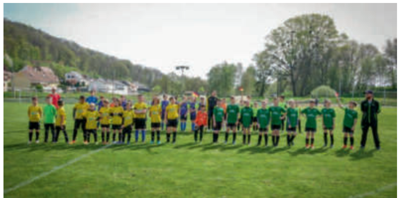
Sportliche Aktivitäten, die während des Weekend Eurosport SaarMoselle angeboten wurden Activités sportives proposées lors du Weekend Eurosport SaarMoselle