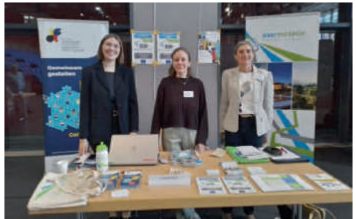
Stand Forum-MOSA / Creutzwald

La coopération franco-allemande a ainsi été mise à l'honneur en ce jour particulier où l'on célébrait la réunification allemande, tout comme Venise, qui était au centre de cette édition de la FIM.