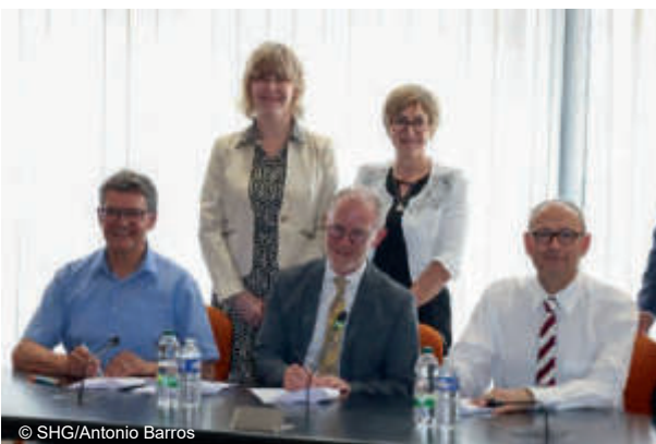
Verlängerung der grenzüberschreitenden Partnerschaft für die Pflegeausbildung

Am 28. Juni 2024 wurde in Saargemünd eine neue Vereinbarung zwischen den Krankenhäusern von Sarreguemines, der Saarland-Heilstätten GmbH (SHG) und der SHG Bildung unterzeichnet, damit die Auszubildenden in der Krankenpflege auch über die Grenze hinweg ihr Wissen vertiefen und Kontakte knüpfen können.