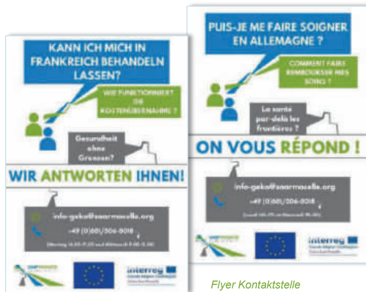
Flyer Kontaktstelle Flyer du point de contact

Lancé en 2021, le point de contact continue à renseigner la population, les professionnels de santé et les institutions en matière d'accès aux soins transfrontalier et les rediriger le cas échéant vers les interlocuteurs concernés (caisses d'assurance maladie, établissements de santé, centres d'information transfrontaliers).