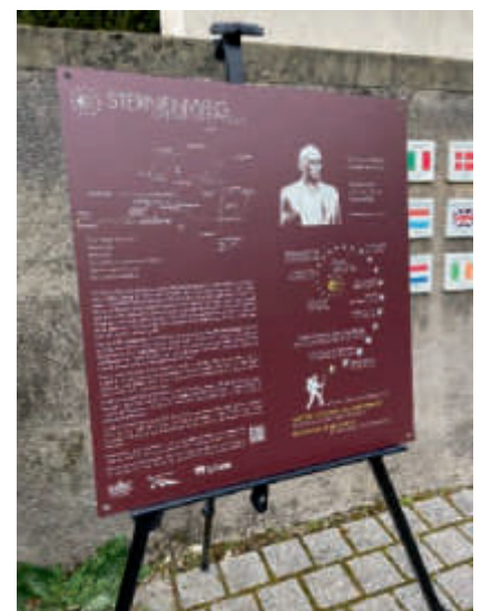
Einweihung der Etappe des Routennetzes Sternenweg, die Jakobspilger durch Scy-Chazelles führt Inauguration de l'étape du réseau Chemin des étoiles, conduisant les pèlerins de Compostelle par Scy-Chazelles