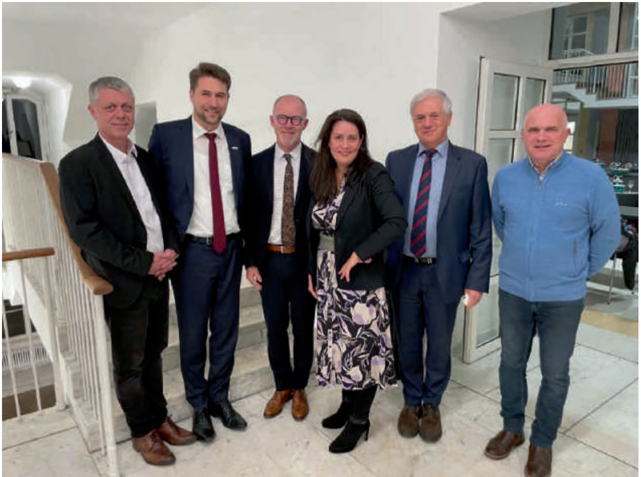
Neu gewählter EVTZ-Präsidium nach der Versammlung im November in Saarbrücken La présidence du GECT nouvellement élue après l'assemblée de novembre à Sarrebruck