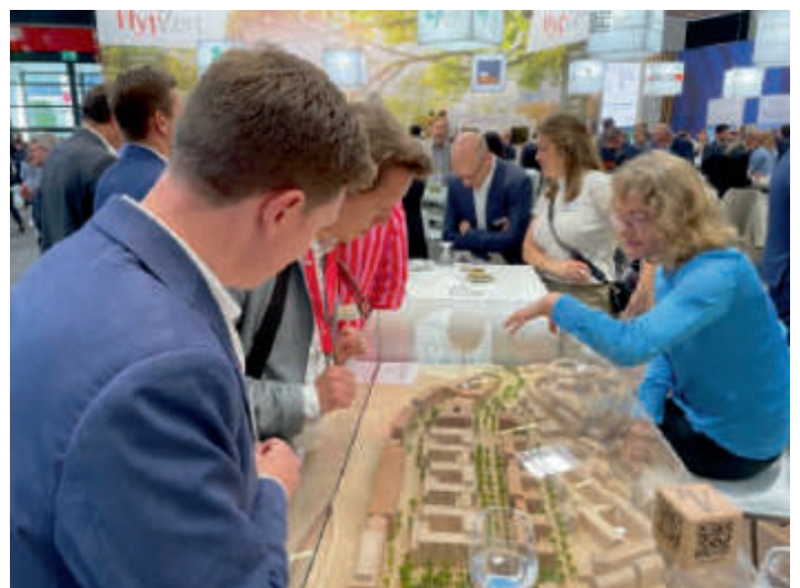
Delegationsreise zur Immobilienmesse Expo Real in München am 7.-9. Oktober 2024. Déplacement en délégation au salon de l'immobilier Expo Real à Munich du 7 au 9 octobre 2024.