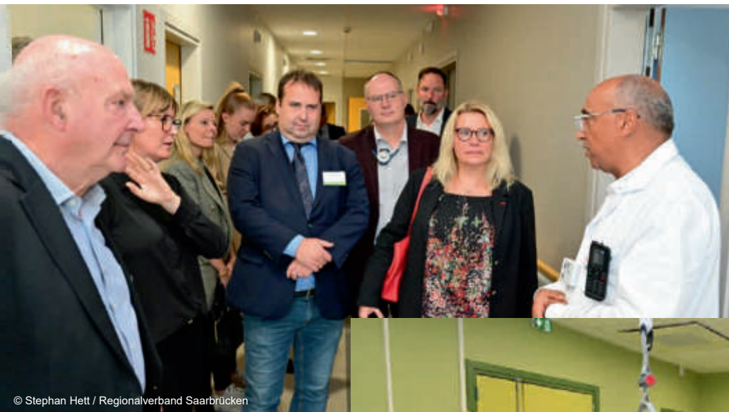
Besichtigung der nuklearmedizinischen Abteilung des Hôpital Robert-Pax in Sarreguemines Visite du service de médecine nucléaire de l'hôpital Robert-Pax de Sarreguemines

Cette signature est d'autant plus importante qu'elle reflète la réciprocité de l'accès aux soins transfrontalier.