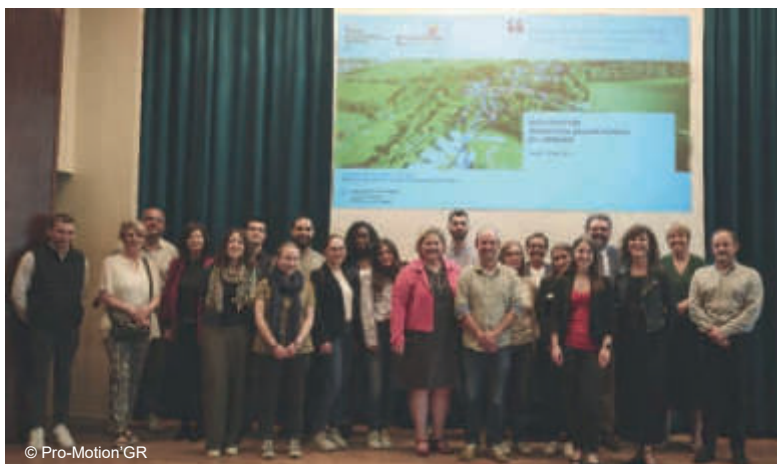
Gruppenfoto am 13.06.2024 bei der offiziellen Eröffnung des Interreg-Projekts Pro-Motion'GR.

Dans ce cadre, le GECT Eurodistrict SaarMoselle a accueilli les partenaires du projet Interreg pour la première réunion du groupe de travail « Forums transfrontaliers », qui s'est tenue le 10 juillet 2024 au sein du bureau de coopération de l'Eurodistrict SaarMoselle, marquant ainsi le coup d'envoi officiel des préparatifs du forum. Des échanges réguliers ont eu lieu entre les partenaires pendant toute la durée de l'organisation.