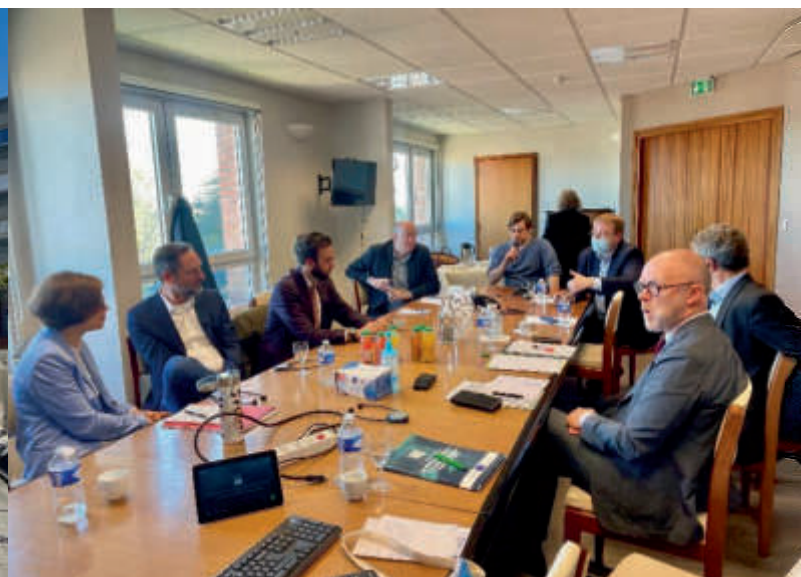
Studienreise zur belgisch-französischen ZOAST Voyage d'étude à la ZOAST franco-belge