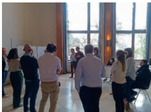
Teilnehmende am ESPON Workshop am 10. April 2024 in der VHS Saarbrücken. Participants à l'atelier ESPON le 10 avril 2024 à l'université populaire de Sarrebruck.