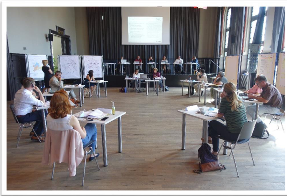
1. Runde des Planspiels Fachgruppe Agglomerationskonzept in der Aula in Sulzbach - Bildquelle AGL Saarbrücken

1er tour du Planspiel pour le groupe technique « Concept d'agglomération » à la Aula de Sulzbach