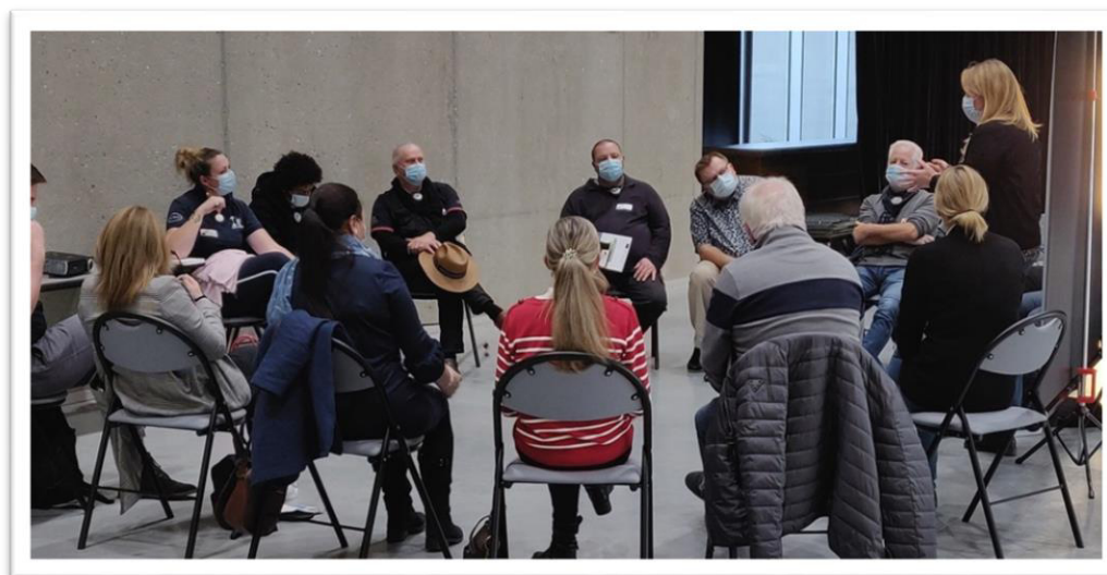
Workshoprunde und Eröffnungsreden der 5. Grenzüberschreitenden Projektbörse in Stiring-Wendel Plénière d'ouverture et groupe de discussion dans le cadre de la 5e Bourse aux projets transfrontaliers à Stiring-Wendel