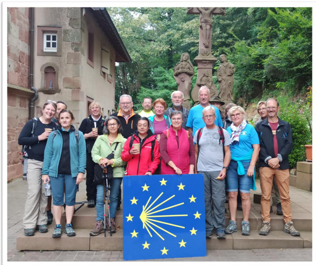
Teilnehmer:Innen an der Jakobswanderung 2021 Participants à la marche de St-Jacques de Compostelle 2021

Le Warndt Weekend 2021 a fait l'objet de deux reportages TV, un sur la chaîne locale de Forbach TV8 et l'autre sur la chaîne sarroise SR. Tout ce programme n'aurait jamais eu lieu sans l'aide de toutes les associations, offices de tourisme, fédérations, communes et intercommunalités françaises et allemandes qui font vivre aux concitoyens de SaarMoselle, le temps d'un week-end, des moments inoubliables et ce depuis plus de 20 ans.