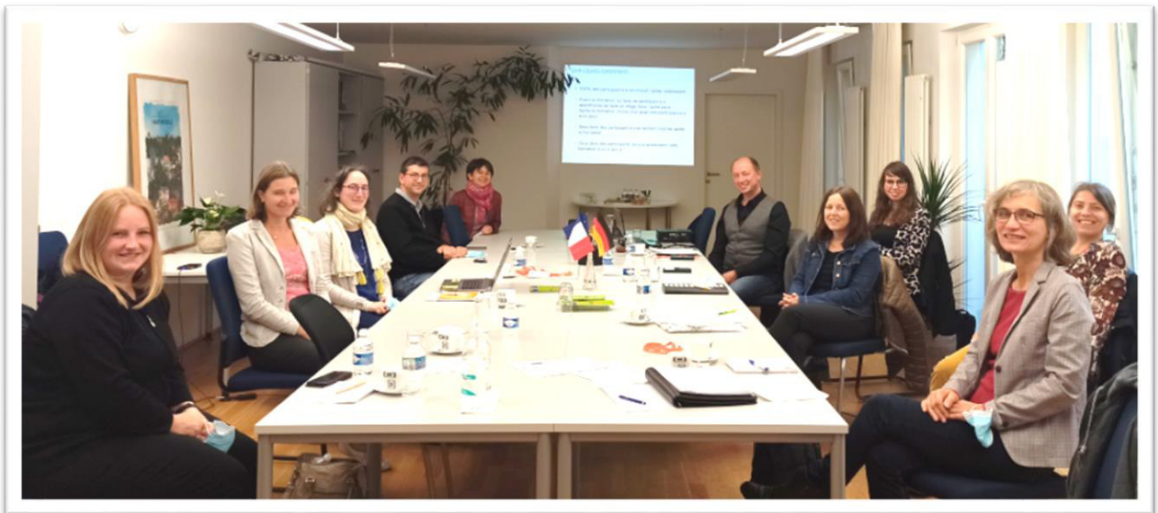
Projektpartnertreffen mit dem Goethe Institut Nancy im Kooperationsbüro am 30.09.21.

Toutes ces actions, mais également la recherche et l'information des entreprises permettent d'encourager les jeunes à effectuer leur stage dans le pays voisin. Cette année, pour la mobilité France-Allemagne, 24 stages ont été réalisés dans des entreprises allemandes. 3 stages ont été organisés dans une entreprise lorraine. Depuis le début du projet, ce sont 321 jeunes qui ont pu effectuer un stage dans le pays voisin. Ces stages ont été organisés et subventionnés par le VAUS, le Ministère de l'éducation du Land de Sarre et par le GIP FTLV. Ils ont aussi bien entendu fait l'objet d'un cofinancement du programme Interreg VA Grande Région.